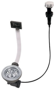
自动下水 8407 100